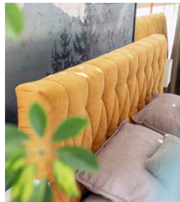
Sorgfältige Handarbeit sieht man an allen Details.