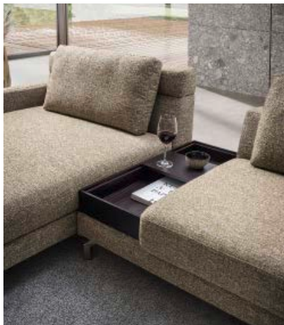
Modell „Ares“ mit zwei Lehnvarianten, Tischelement aus Massivholz und Schlafbankfunktion mit Akku.

„Auf dem Weg in neue Wohnwelten“ zeigt sich Sedda 2023 mit neuen frischen Designs und Innovationen: Pure Ästhetik, gepaart mit vielfältigen Elementen und smarten Funktionen lassen Möbel voller Ausdruckskraft entstehen.