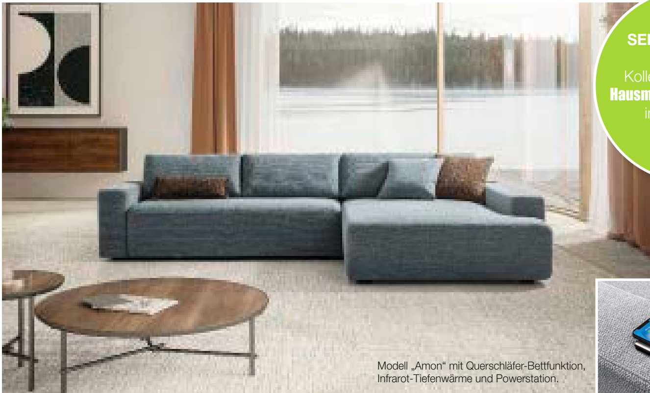
Modell „Amon“ mit Querschläfer-Bettfunktion, Infrarot-Tiefenwärme und Powerstation.

SEDDA präsentiert seine neuen Kollektionen auf den Hausmessen Oberfranken im Showroom von Ponsel.