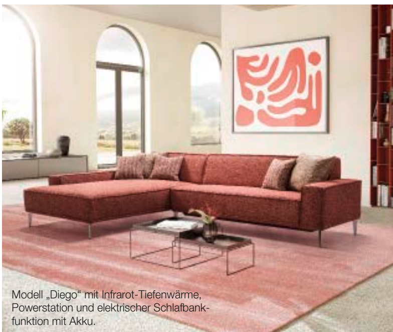
Modell „Diego“ mit Infrarot-Tiefenwärme, Powerstation und elektrischer Schlafbank- funktion mit Akku.