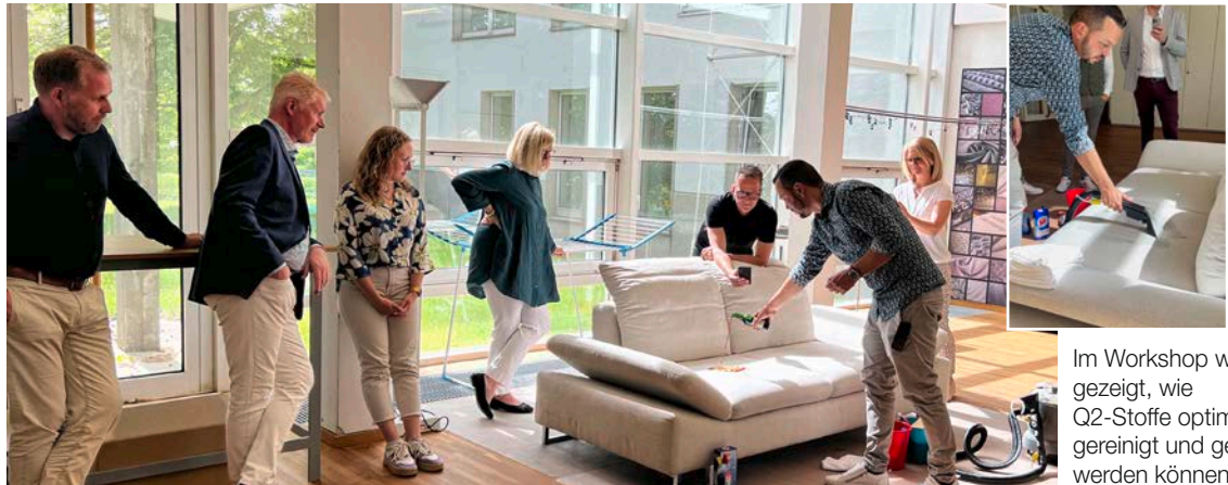
Im Workshop wird gezeigt, wie Q2-Stoffe optimal gereinigt und gepflegt werden können.

An dem Standort in Oberfranken werden die unterschiedlichsten Stoffqualitäten für namhafte Textilverlage und Möbelhersteller in aller Welt produziert. Speziell für die Industrie liegt der Schwerpunkt auf Performance-Stoffen der Marke Q2. Diese beeindruckende Expertise macht Rohleder nicht nur zu einem global geschätzten Partner der Textilbranche, sondern auch zu einem idealen Ort für textile Weiterbildung. „Im Rahmen einer professionellen Textilschulung – der Rohleder Academy – mit Schwerpunkt