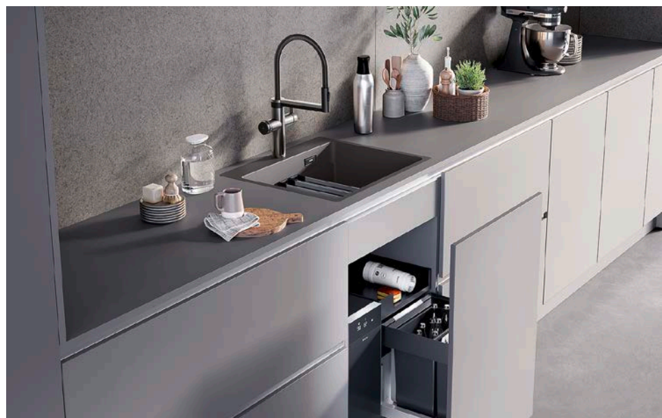
Die Verbindung aus Spüle, Armatur, Wasseraufbereitungseinheit und Organisationssystem im Unterschrank bietet einen optimalen Wasserplatz.

Ein besonderer Clou ist die „Blanco Unit-App“. Sie ermöglicht alternativ zum Touch-Display am Gerät die Steuerung des Systems via Smartphone. Dabei bietet sie zusätzliche Optionen zu individuellen Einstellungen, Verbraucherstatistiken, Technik-Support und vielem mehr. So können beispielsweise präferierte CO 2 -Intensitäten auf festen Belegplätzen gespeichert werden. Damit erhält jedes Haushaltsmitglied auf Knopfdruck seine persönliche Wasseraufbereitung.