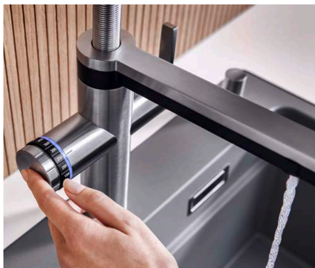
So sprudelt die Genussquelle: einfach Wasserart und -menge wählen und per Finger-Tipp den Wasserfluss starten.