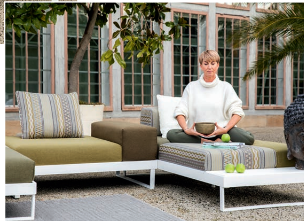
Die unterschiedlichen Sitzelemente von „bailandoo“ lassen sich individuell auf die Sockelplateaus stecken – ganz nach Wunsch.

W.Schillig bringt den Wohnkomfort jetzt auch auf Terrasse, Balkon und direkt in den Garten – so kommt hochwertiges Wohnen nach draußen. Farbenfroh und lebendig präsentierte W.Schillig zur Herbst-Hausmesse seine neue Outdoor-Kollektion, die ihre Premiere auf der Gardiente feierte. Das inhabergeführte Familienunternehmen nutzte seine hohe Entwicklungskompetenz im Bereich Sitzkomfort und entwickelte eine durchdachte Kollektion für das perfekte Outdoor-Wohngefühl.