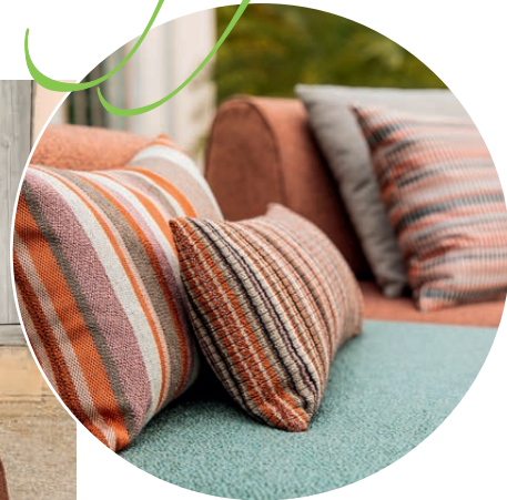
Modell „bailandoo“ ist mit dem outdoor-geeigneten Q2-Markenstoff von Rohleder bezogen.