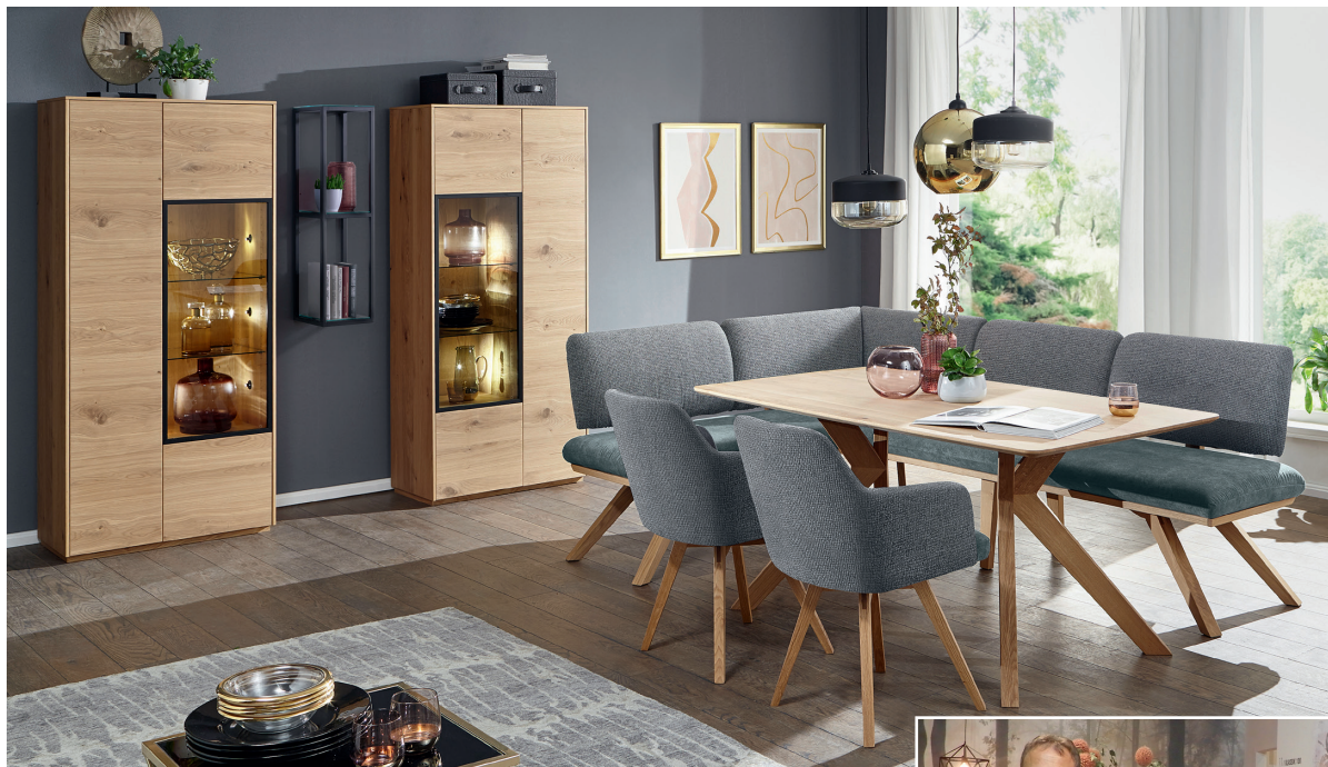
Absolutes Messe-Highlight war das variantenreiche Dining-Sofa „Lima“.

Schösswender präsentierte sich live im Informa-Zentrum sowie digital beim kuechenherbst.online | Neue Konzepte