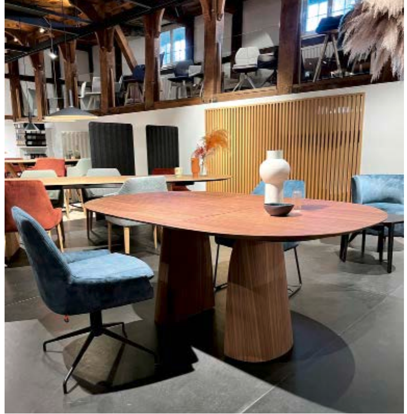
Wird der Tisch „Blossum“, hier kombiniert mit dem Stuhl „Saga“, durch Einlegeplatten erweitert, teilt sich auch der zentrale Fuß und sorgt für Standfestigkeit.

durch seine leichte Streckung bietet er aber mehr Besuchern gleichzeitig Platz. So reicht ein nur 135 x 160 cm großer Tisch locker für 7 bis 8 Personen, ohne dass es eng wird. Der Tisch steht auf einem Zentralfuß, über dem sich die Tischplatte in verschiedenen Eiche- und Nussbaum-Ausführungen ausbreitet, wie eine Blüte über ihrem Stängel. Auf Wunsch lässt sich „Blossum“ auch