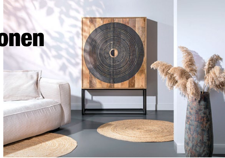
Angesagter Retrostyle mit stylischen Altholzmöbeln und Cordsofa.

Die oberfränkischen Lifestyle-Spezialisten haben einmal mehr die topaktuellen Wohntrends aufgespürt und in konsumige Möbelhauskonzepte integriert. Die verschiedenen Trendkojen