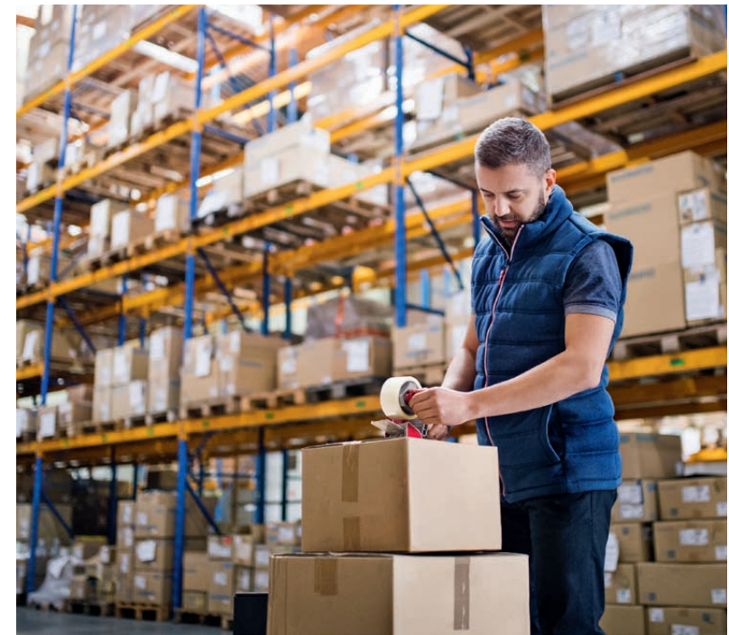
Ebay unterstützt die Händler mit effizienten Versand- und Fulfillment-Lösungen.

konzentrieren können. Daher setzt der Service auf eine einfache Warenübergabe, flexible Vertragsbindung sowie sicheren und schnellen Versand inklusive Ebay-Verkäufererschutz durch garantierten Scan bei der Abholung. Bei der Organisation der Abholung vertraut Ebay dem langjährigen Kooperationspartner Fiege und seinem großen Netzwerk von Partnerunternehmen. Diesen Herbst wird die Abholung am gleichen Tag auch für Düsseldorf und